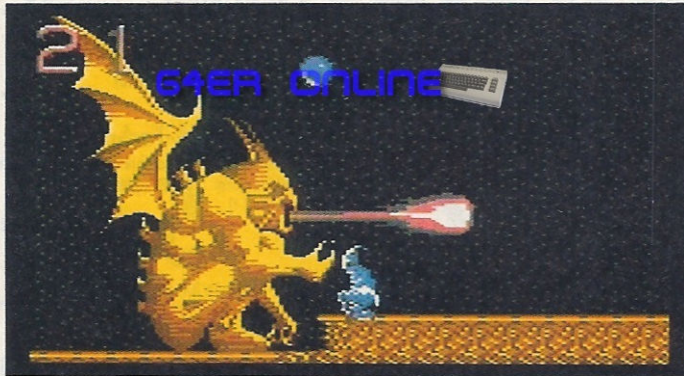
Der kleine Ball ist eine verborgene Extrawaffe