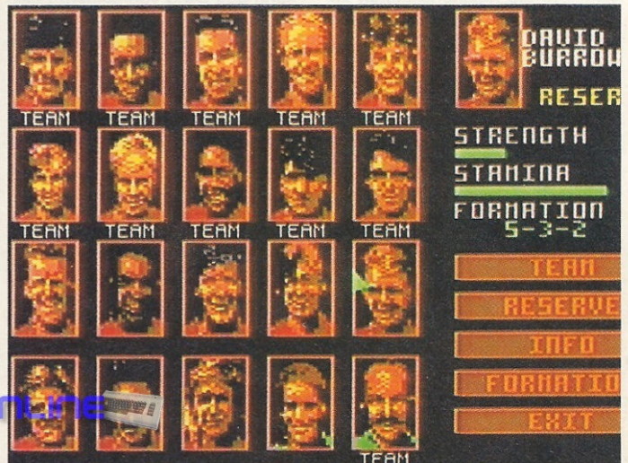
Mannschaftsaufstellungen können leicht vorgenommen werden, haben aber keinen besonderen Einfluß auf die Spielstärke

Titel: Liverpool, Preis: ca. 45 Mark, Bezugsquelle: Data House, Kai-Uwe Dittrich, Husumer Str.13, 34246 Vellmar