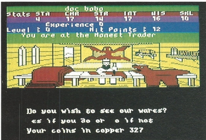
Bild 1. Einkaufsbummel bei Alternate Reality